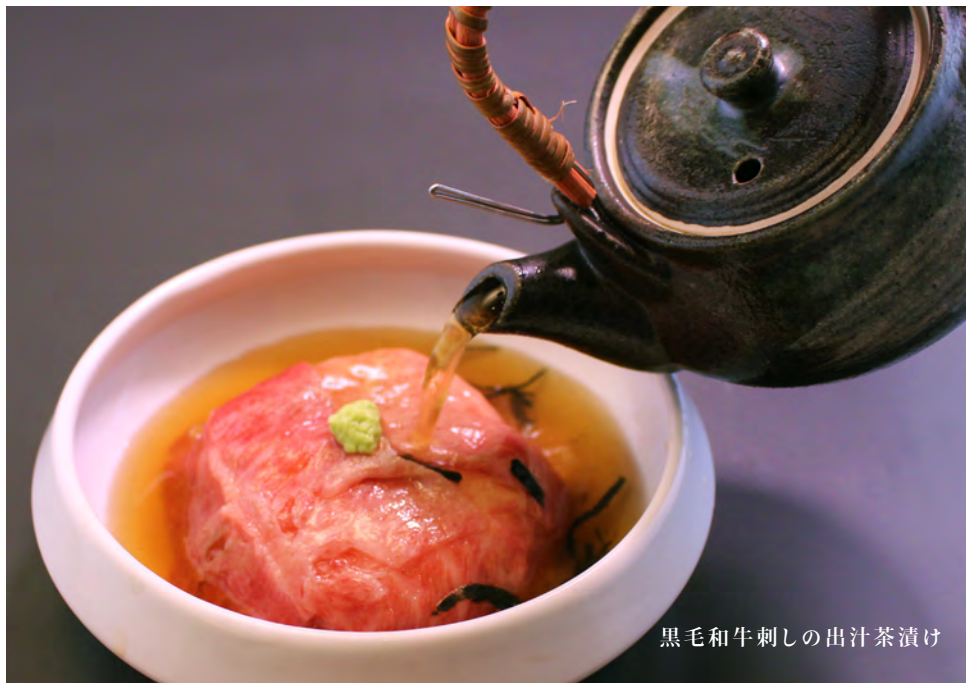
黒毛和牛刺しの出汁茶漬