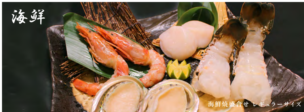
海鮮焼盛合せ レギュラーサイズ